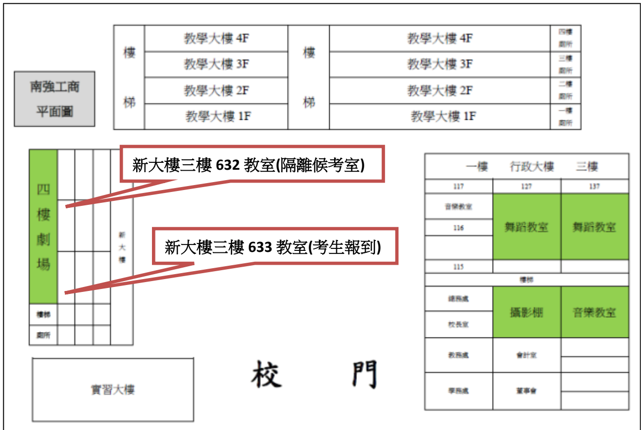
△考場位置平面圖：考生報到地點及隔離候考室

一般考生報到教室在新大樓三樓 633 教室，術科考場在新大樓四樓實驗劇場。隔離候考室在新大樓三樓 632 教室、備用試場在新大樓四樓實驗劇場(如有隔離考生將其考試序號調動為最後梯次)。