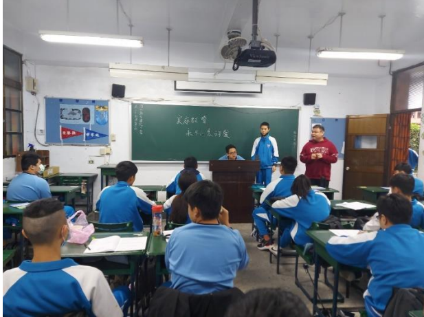
109/12/21 失親議題班會討論:永不止息的愛