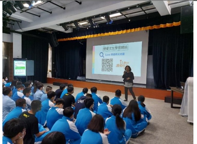
109/11/23 經營優質的親密關係講座第二場