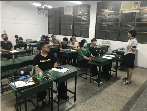
109/9/3 建教班進職場前家長說明會