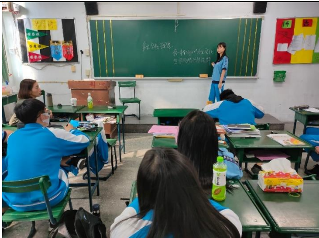
110/3/15 班會討論:有一種 style 叫多元文化