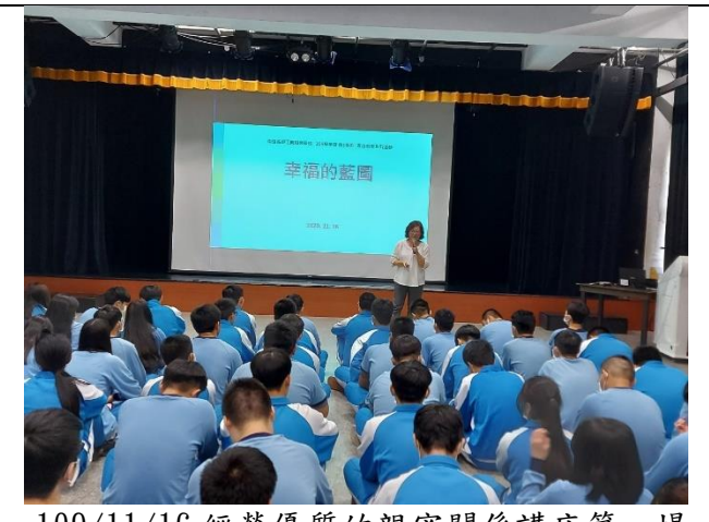
109/11/16 經營優質的親密關係講座第一場