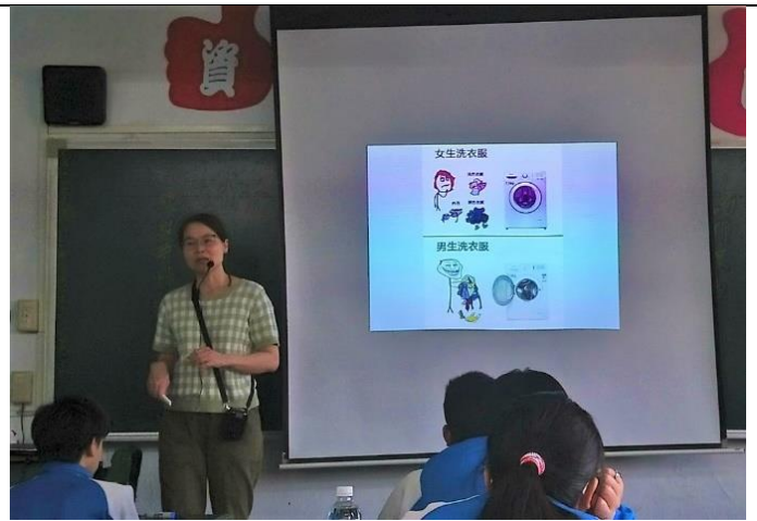
110/4/23、30 班級家庭教育課程-家庭美滿