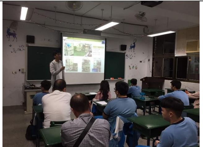
109/11/16 建教班職場輪調變更家長說明會