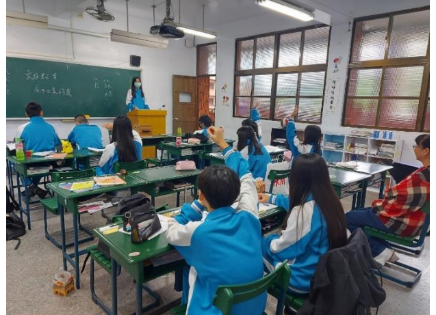
109/12/21 失親議題班會討論:永不止息的愛