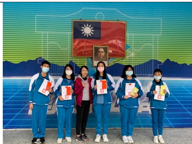
109/11/1~11/30 性別平等教育議題徵稿比賽頒獎