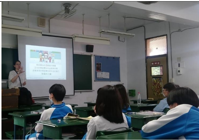
110/4/23、30 班級家庭教育課程-家庭美滿