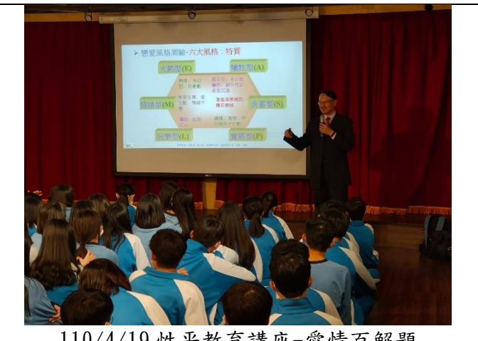
110/4/19 性平教育講座-愛情百解題