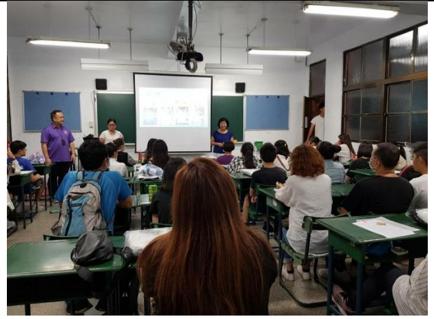
109/8/14 建教班新生進職場前家長說明會