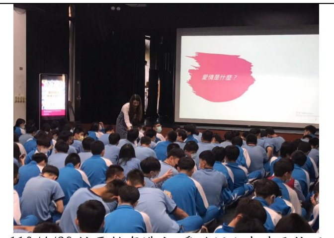
110/4/26 性平教育講座-愛的語言表達及技巧