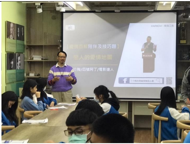
110/4/14 愛情百解陪伴及技巧題小團體