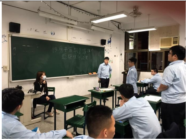
109/11/23 性平教育班會討論：拒絕性別歧視