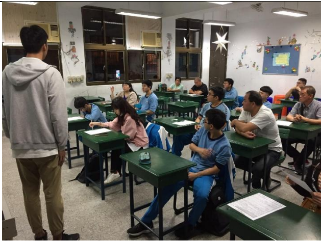
109/11/16 建教班職場輪調變更家長說明會