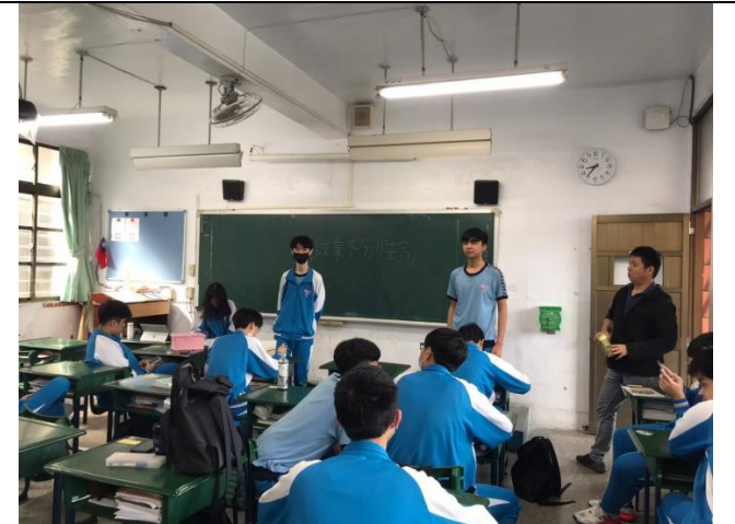
110/4/19 性平議題班會討論：職業不分性別