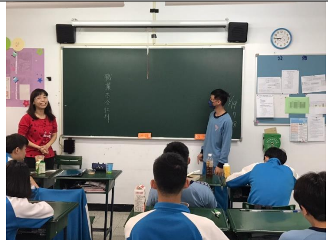
110/4/19 性平議題班會討論：職業不分性別