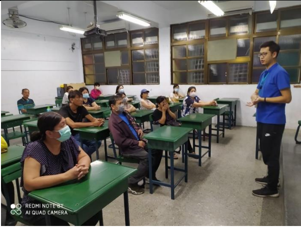
109/8/14 建教班新生進職場前家長說明會