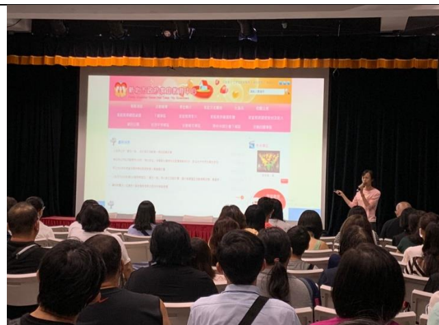
109/09/18 家長日暨親職宣導講座