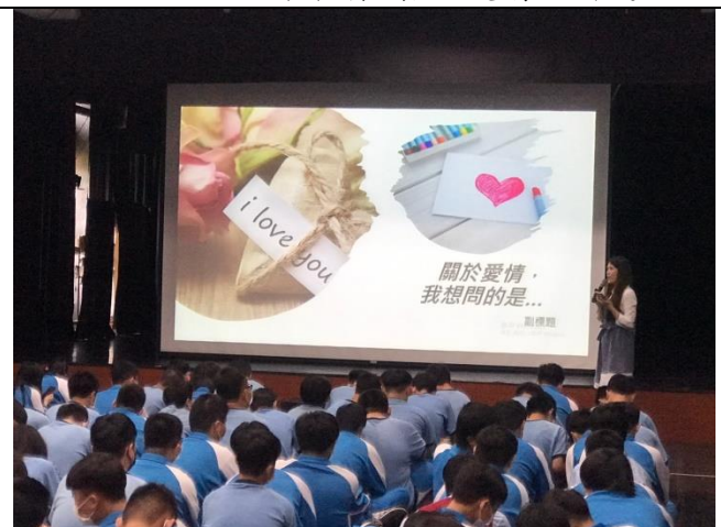
110/4/26 性平教育講座-愛的語言表達及技巧