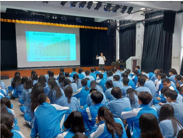
109/11/16 經營優質的親密關係講座第一場