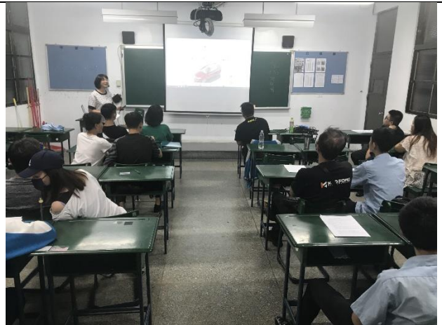
109/9/3 建教班進職場前家長說明會