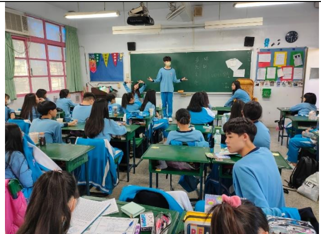
110/3/15 班會討論:有一種 style 叫多元文化