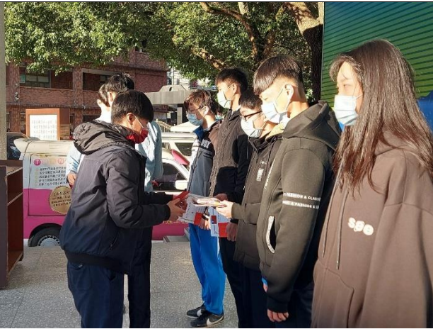
109/12/01~12/31 家庭教育議題徵稿比賽頒獎