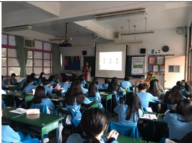
109/11/23 愛的三角理論班級課程