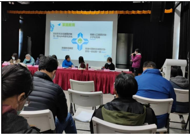
110/2/19 校務會議中推廣家庭教育