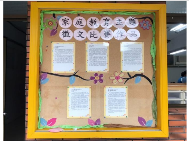
109/12/01~12/31 家庭教育徵稿比賽作品展示