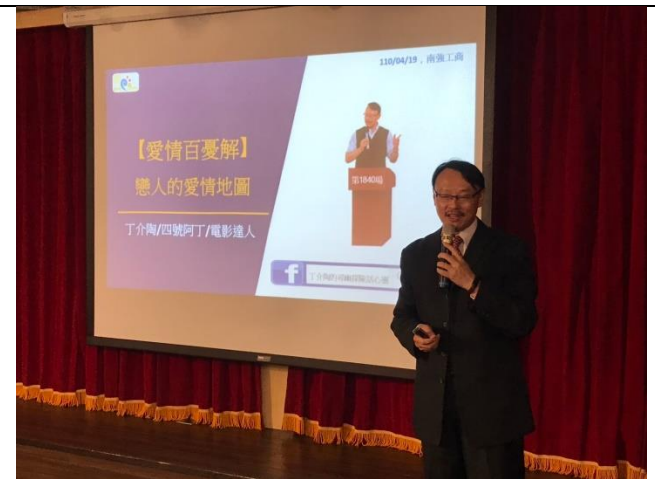
110/4/19 性平教育講座-愛情百解題