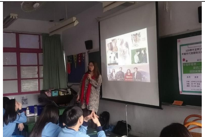
109/11/23 愛的三角理論班級課程