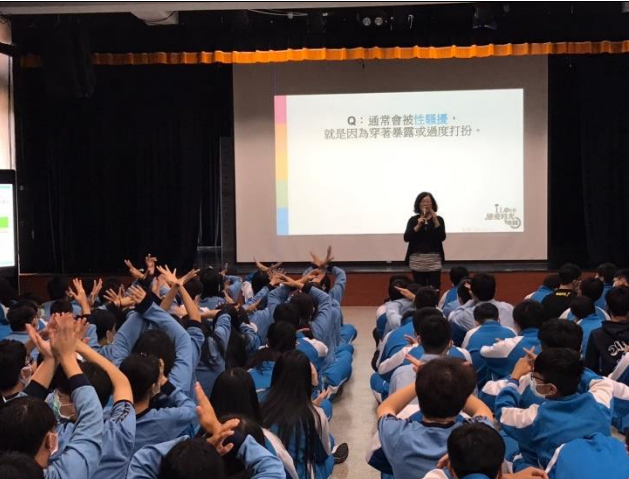
109/11/23 經營優質的親密關係講座第二場