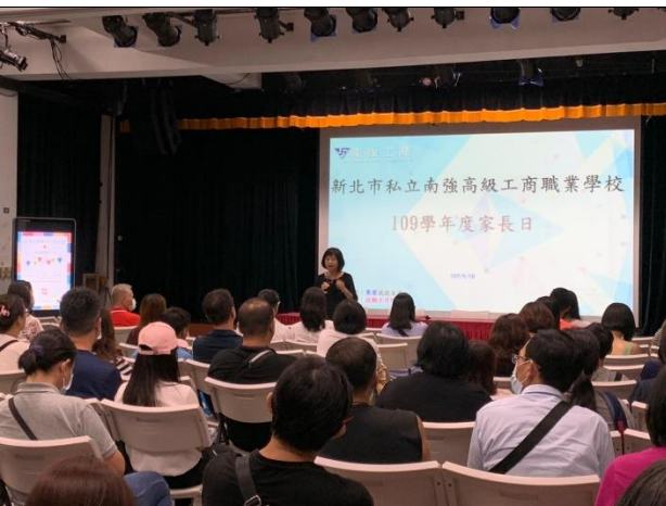
109/09/18 家長日暨親職宣導講座