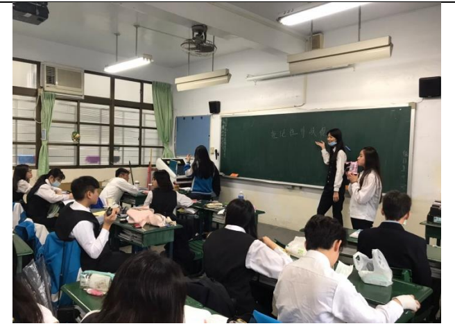
109/11/23 性平教育班會討論：拒絕性別歧視