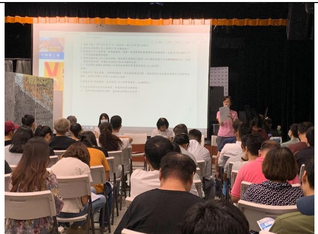
110/3/29 導師會議中推廣家庭教育