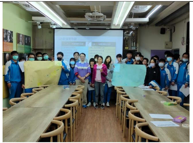
110/4/14 愛情百解陪伴及技巧題小團體