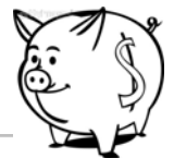
原私校退撫基金(舊制) 110年度1月至9月期間收益率