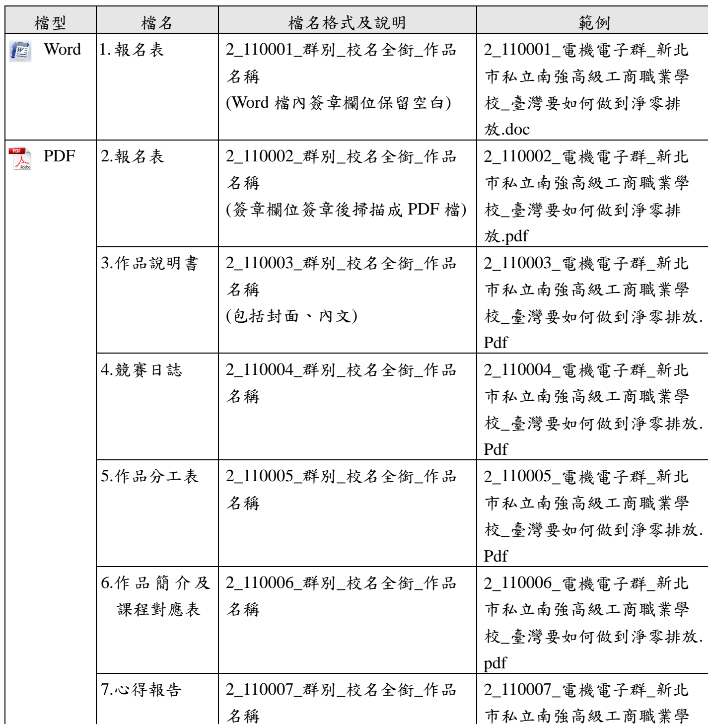
表 1-4 4 創意組電子檔隨身碟範例說明