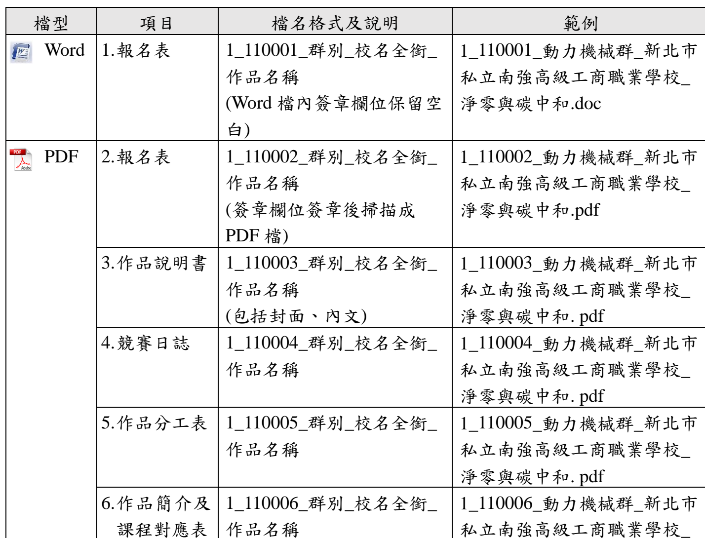
表 1-22 專題組電子檔隨身碟範例說明